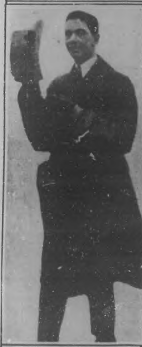
El Príncipe heredero de Italia