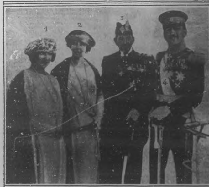
LA HERMOJA REINA MARIA DE RUMANIA