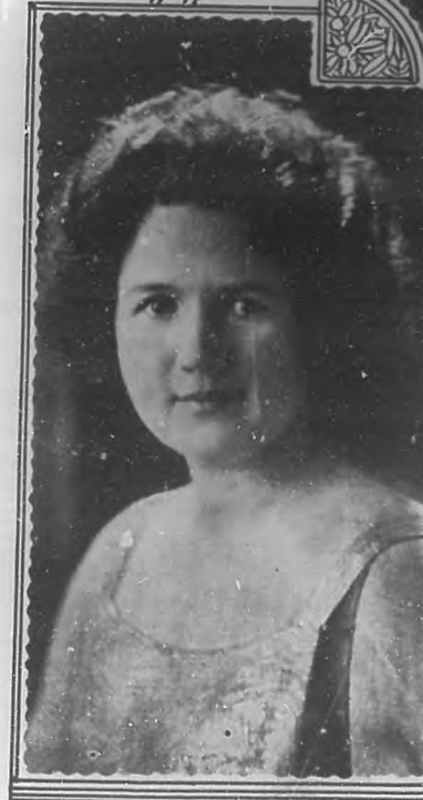
Karin Branzell Mezzo-soprano

La música es emotiva y tiene el raro merito de no interrumpir la acción. Las situaciones dramáti cas en ningún caso son perturb das por exigencias melódicas. Von Schillings sacrificó su ambición de hacer gran música por salvar una trama, que sin tener gran impor tancia, lespierta cierto interés. Para mí resulta música tedia; ári da, pero no dejo de comprender el mérito que entraña. Caracterizada Bárbara Kemp de Mona Lisa, es la más pura seme