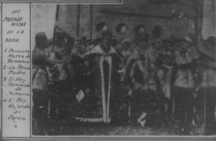
La coronación de los Reyes de Rumania