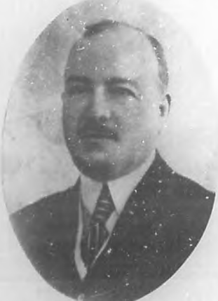
EL EXCMO. SR. EDUARDO RUIZ Ministro de México en Costa Rica.

Todavía es muy prematura mi contestación a su interesante cuestionario pues debí dejar