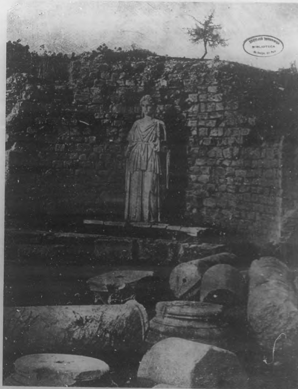
UN IMPORTANTE DESCUBRIMIENTO ARQUEOLOGICO.—Ruinas del templo de Pythia Apolo, descubiertas recientemente en la isla de Creta, entre las que aparece la estatua del dios allí venerado.

Redacción, Administración y Talleres: Edificio de BOHEMIA, América Latina (antes: No. 91 y 92 número 50, 91 y 92). Teléfono: Dirección, M-122; Administración, A-258.